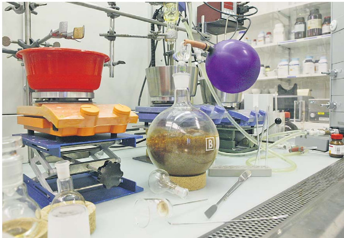
Mehr Platz. Der Engpass an Laborflächen schwindet dank mehreren neuen Laborgebäuden merklich.

Schneller fertig wird das Projekt 47 im iParc in Allschwil. Schon Ende Jahr sind dort knapp 6000 m 2 bezugsbereit und ein Jahr darauf kommen weitere knapp 6000 m 2 dazu. Im Technologie Zentrum Witterswil schliesslich kommen auf Anfang nächsten Jahres weitere 500 m 2 hinzu.