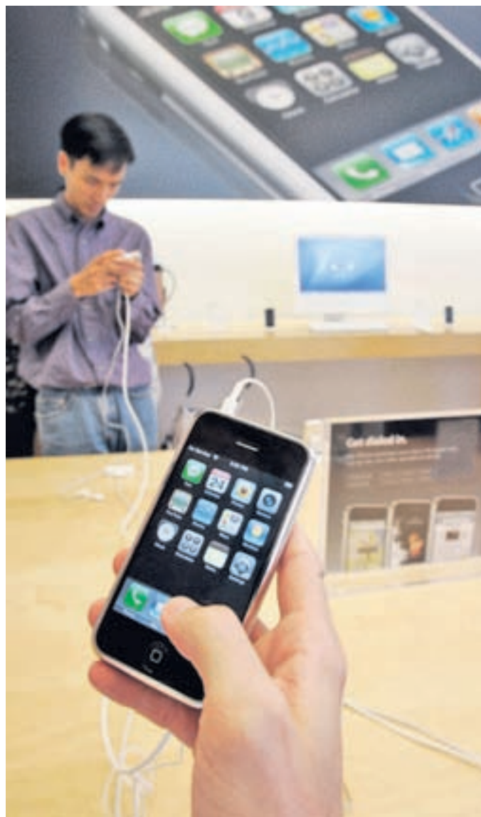
Objekt der Begierde. Die Swisscom setzt auf das iPhone von Apple, das seit knapp einem Jahr auf dem Markt ist.

Inzwischen haben viele Anbieter nicht nur die Optik, sondern auch die neue Bedienereinfachheit kopiert. Geräte wie das «Touch Diamond» von HTC oder das «X1» von Sony Ericsson stehen bereit und richten sich an ein ähnliches Publikum. Mit gleichartiger