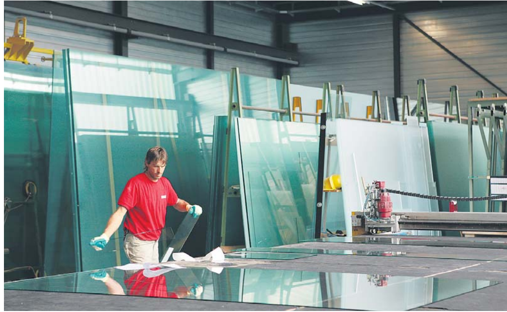
Vorsicht Glas. Das Glas wird in 6 mal 3 Meter grossen Scheiben bezogen und dann zugeschnitten.

Die Blaser AG feiert ihr 125-jähriges Jubiläum